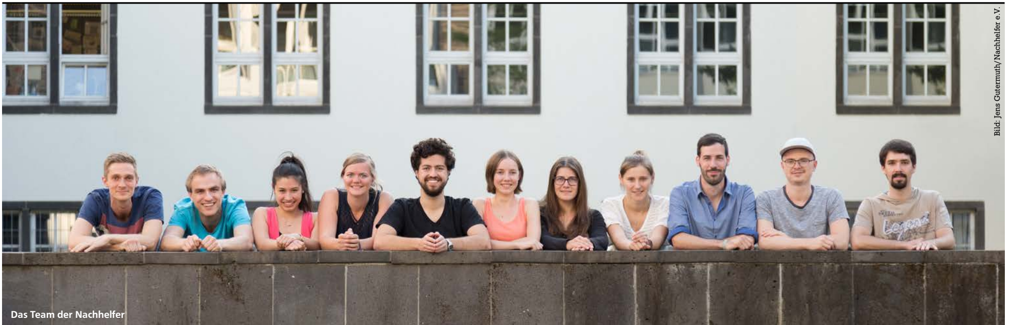
Das Team der Nachhelfer