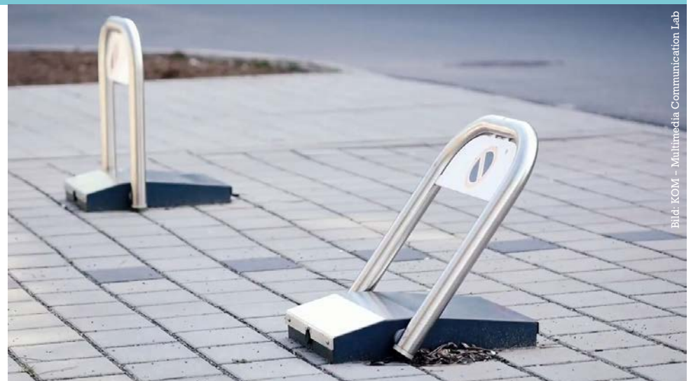
Per App lassen sich die Parkbügel steuern.

Das Video zur App gibt es auf bit.ly/2we6yBt