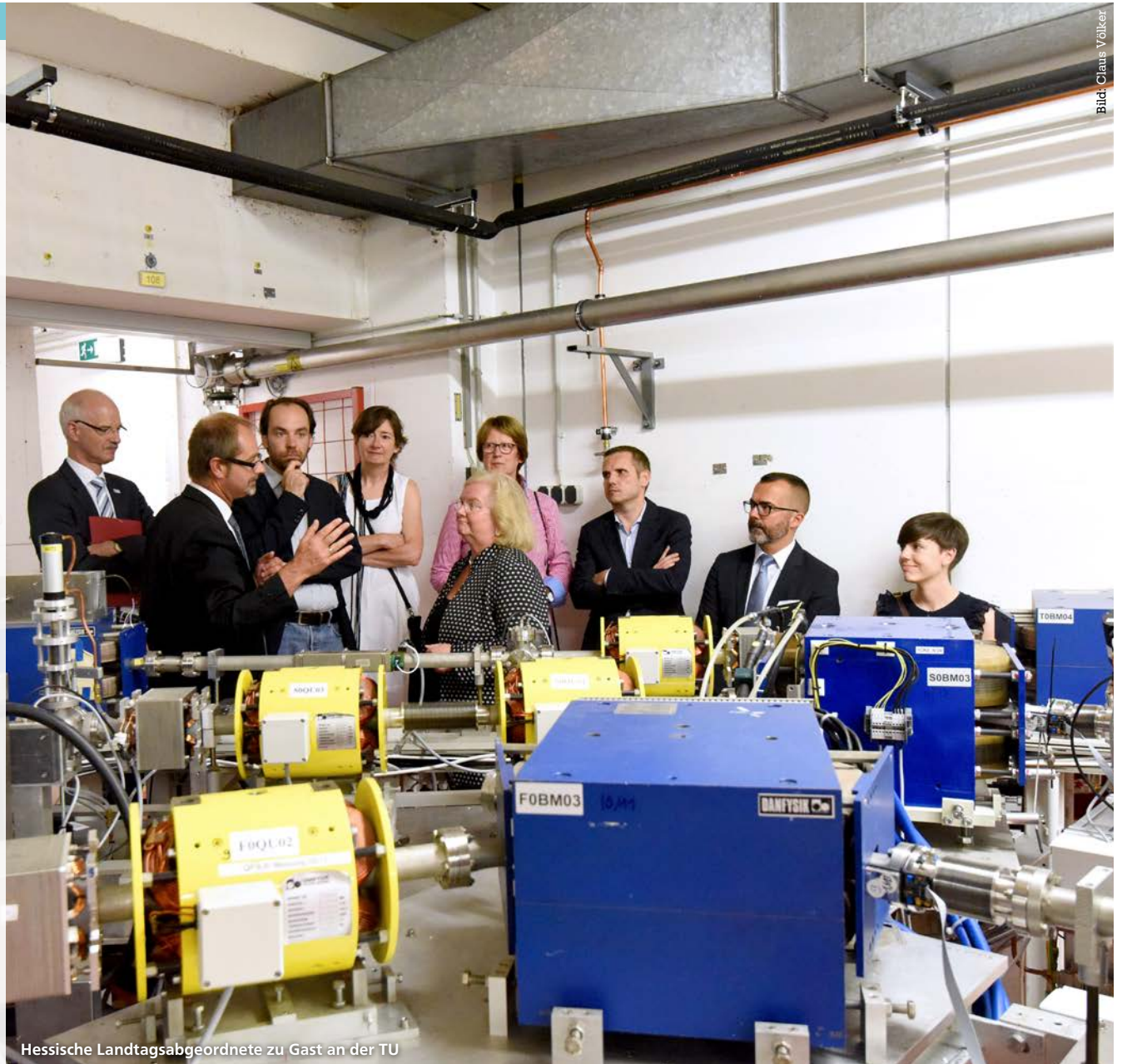
Hessische Landtagsabgeordnete zu Gast an der TU