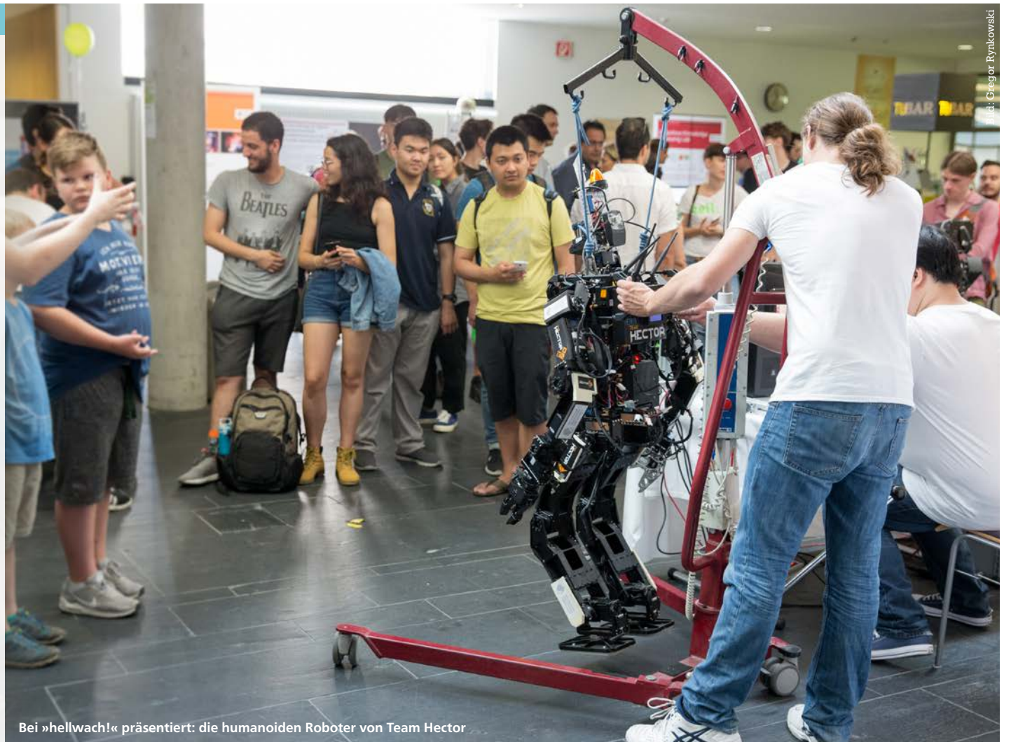
Bei »hellwach!« präsentiert: die humanoiden Roboter von Team Hector

Mehr als 50 Führungen – alle so gut wie ausgebucht. Rund 200 TU-Angehörige im vollen Einsatz. Und mehrere tausend Besucherinnen und Besucher, zumeist junge Familien, die sich sechs Stunden lang begeistern ließen: Die TU Darmstadt zeigte bei ihrem zweiten Wissenschaftstag »hellwach!« im Juni, was sie auf den Campus Lichtwiese und Stadtmitte an spannender Forschung in den Ingenieur- und Naturwissenschaften, Geistes- und Sozialwissenschaften zu bieten hat. So konnten die Gäste etwa der Feuerwehr beim virtuellen Löschen helfen, im digitalen Familiennamenwörterbuch stöbern oder erfahren, wie man mit einem autonomen Segelschiff den Atlantik überquert. Bei Führungen konnten Orte wie die Hochspannungshalle, der S-DALINAC-Elektronenbeschleuniger oder die Mensa-Großküche entdeckt werden, die sonst verschlossen sind. In Gesprächsrunden stellten sich Wissenschaftlerinnen und Wissenschaftler dem Dialog zu aktuellen Themen wie autonomes und elektrisches Fahren und künstliche Intelligenz. Alles in allem: ein rundum gelungener Nachmittag!