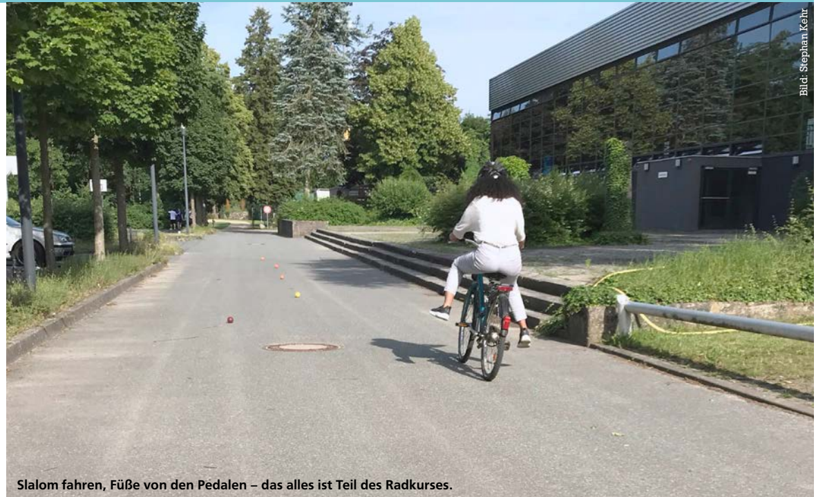
Slalom fahren, Füße von den Pedalen – das alles ist Teil des Radkurses.

Also höchste Zeit für das USZ, zu handeln! Begonnen haben wir das Projekt mit einem Radspendenauftrag im Kreise unserer aktiven Übungsleitenden und Sporttreibenden des Unisports. Viele sehr gut erhaltene Räder und Helme haben so den Weg zu uns gefunden, und es gilt, an dieser Stelle nochmals ein großes Dankeschön an alle auszusprechen, die mit ihrer Spende geholfen haben, diesen Kurs überhaupt erst möglich zu machen. Analog zu unserem seit Jahren schon sehr stark frequentierten Angebot des Anfängerschwimmens suchten wir anschließend qualifizierte Radsportlerinnen und Radsportler in unseren Reihen mit pädagogischem Geschick und multilingualer Kompetenz.